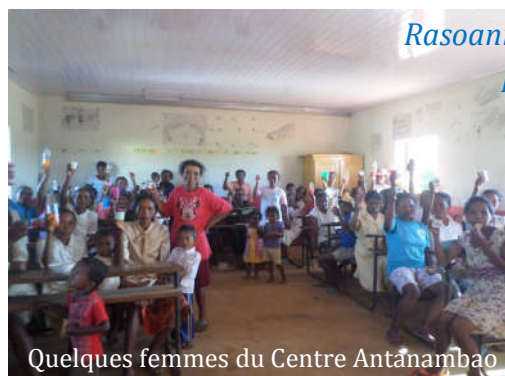
Quelques femmes du Centre Antanambao