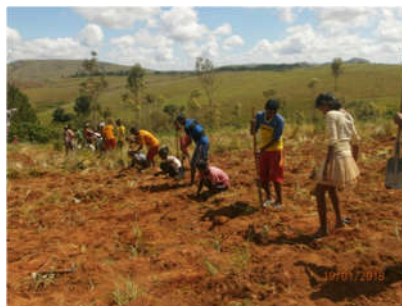
Les jeunes du CMR en plein reboisement